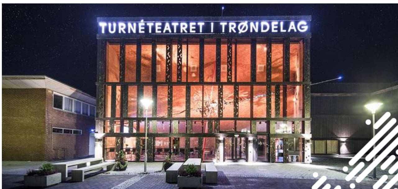
Turneteatret i Trøndelag